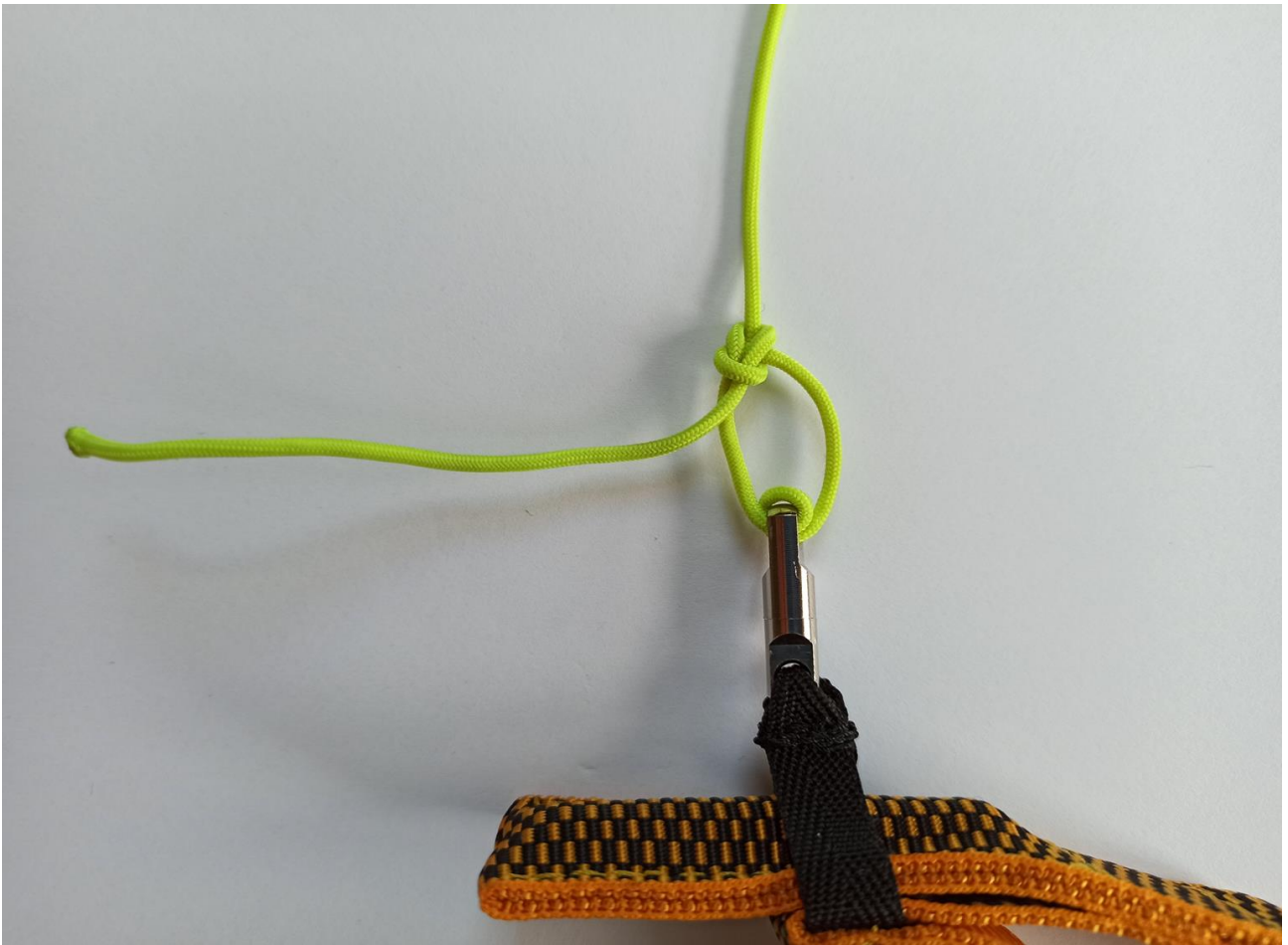
Fertig montierter Griff